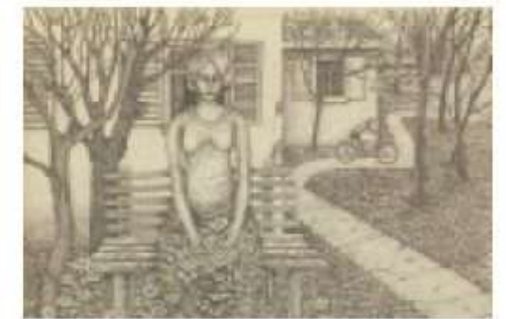
משה כגן, "ציפייה"

גלריית טרומפלדור טרומפלדור 19, באר שבע "70 שנה: פרט ומדינה" תערוכה קבוצתית 26.8-21.6