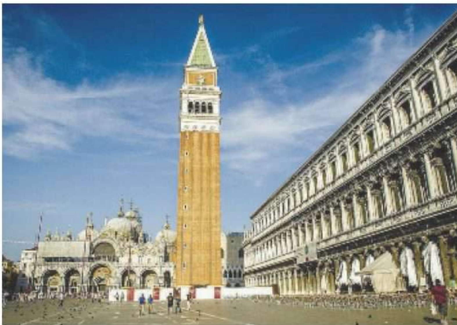
כיכר סן מרקו בוונציה. נפוליאון קרא לה "הסלון היפה של אירופה"

הגשר האחרון עד כה בוונציה הוא "גשר החוקה" שתיכנן האדריכל סנטיאגו קלטרורה ונחנך ב-2008. זהו הגשר הרביעי מעל התעלה הגדולה. הוא מחבר בין תחנת הרכבת סנטה לוצ'יה לבין מסוף התחבורה בפיאצלה רומא. יופיו טמון בשלד צלעות מרהיב וסמוי כמעט מעין הנושא את משקלו. בהבדל מגשר המיתרים הט"ו וסיי שתיכנן קלטרורה בירושלים, גשר החוקה מרכיז ראש בפני יופיה של ונציה. קלטרורה רואה בו בצדק את "הגשר הכי יפה שלי", אבל באיטליה הוא התקבל כמטח של טענות וגם זה בצדק. עם זאת אם יחזיק מעמד פגמיו ייכנסו כסיפורי עם מופלאים למדריכי התיירות של הדורות הבאים.