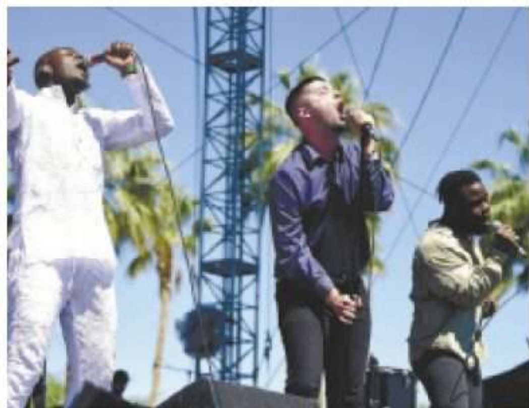
חברי "Young Fathers"