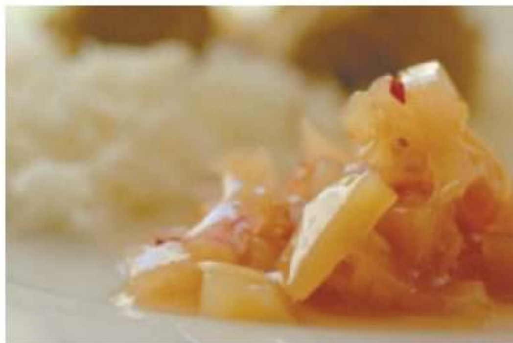
צ'אטני פפאיה יוקרה.

א. תזונה פליאוליטית מאפשרת אכילה של מעט יותר חלבונים. ב. תזונה פליאוליטית מאפשרת אכילה של מעט יותר שומנים. ג. תזונה פליאוליטית מאפשרת אכילה של מעט יותר פחמימות — בצורה של פירות, ירקות שורש עמילניים, שקדים ואגוזים ולעי"תים אף דבש. ה. כל התשובות נכונות.