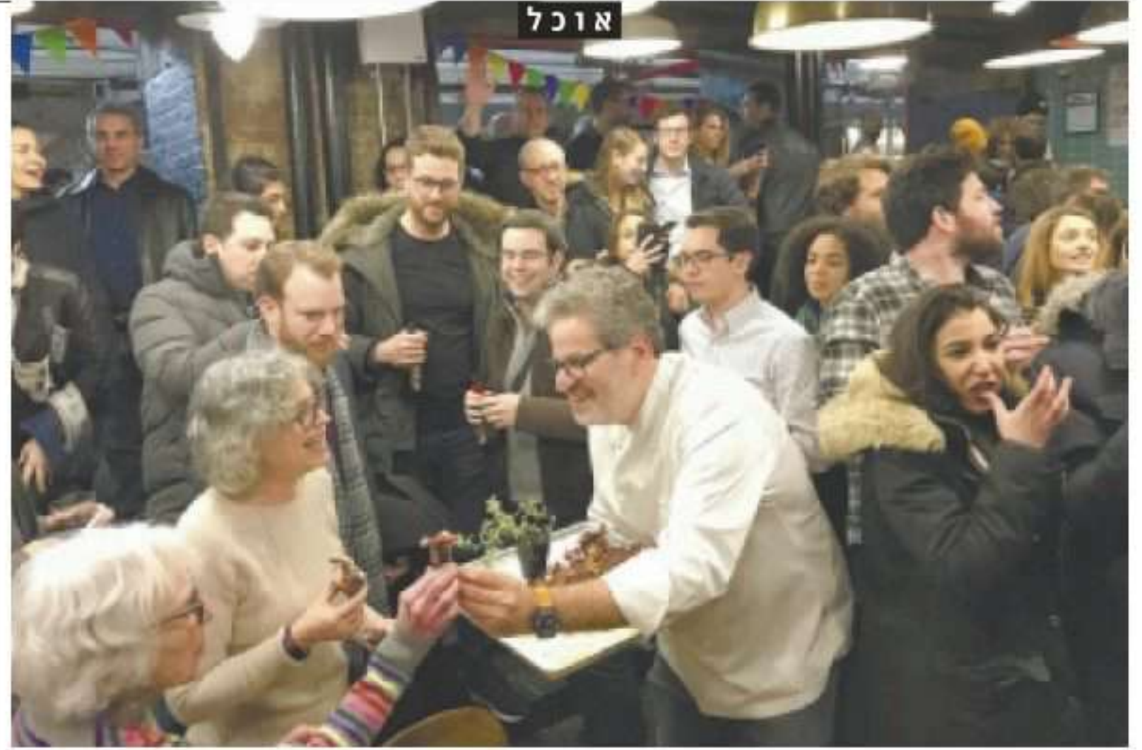
אייל שני בפתיחת "מזנון" בניו יורק. המחיר קובע יוקרה, היוקרה קובעת טעם.