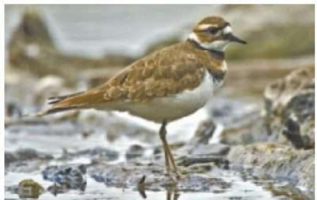
חופמי כפול צווארון. ציפור זעירה וצוחנית

ציפור זעירה, הידועה בצוחות שלה, מאיימת לפגוע באחד מפסטיבלי המוזיקה הגדולים בקנדה אחרי שבנתה קן במקום שבו אמ"רה להיות הבמה המרכזית. הרמז הראשון לבעיה שמטרידה את מנהלי "אוטווה בלופסט", פסטיבל המתקיים תחת כיפת השמיים ומ"ר שך כ-300 אלף איש בכל שנה אל בירת קנדה, צץ בשבוע שעבר. פ"ר עלים באתר שבו אמור להתקיים הפסטיבל הבחינו בציפור ממין חופמי כפול צווארון מתנהגת באופן נסער. הציפור, שצבעה חום ואפור ומשקלה פחות מ-100 גרם, נחשבת למוגנת בקנדה. היא הטי"לה ארבע ביצים על אבן באזור הבמה המרכזית. "זהו אחד האתגרים הגדולים שנתקלנו בהם, אך אנחנו חושבים שנוכל להתגבר עליו", אמר מארק