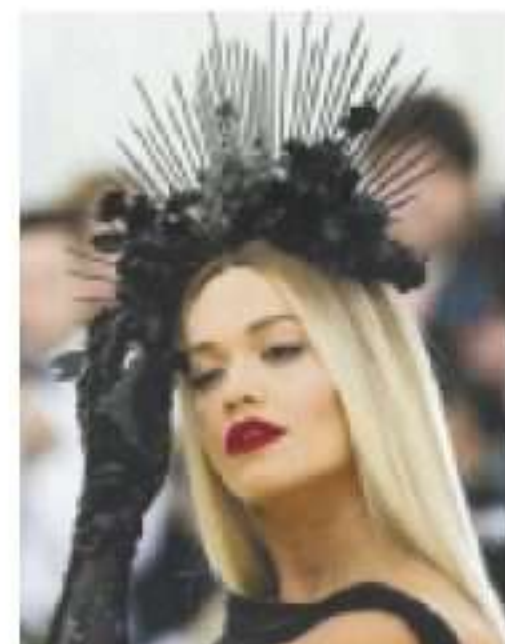
ריטה אורה. פתק מהרופא

הזמרת אמריקאית ריטה אורה ביטלה את הופעתה בישראל, שהיתה אמורה להתקיים בחודש הבא באמפי לייב פארק בראשון לציון. על פי מפיקי המופע, נציגיה של אורה מסרו כי הביטול נרבע מסיבות רפואיות וכי היא צפויה לעבור ניתוח באותו הזמן בו היתה אמורה להתקיים ההופעה בישראל. הודעת הביטול מגיעה יממה אחרי שהופיעה מול קהל של עשרות אלפים בדבלין. טרם פורסמו ביטולים נוספים של אורה