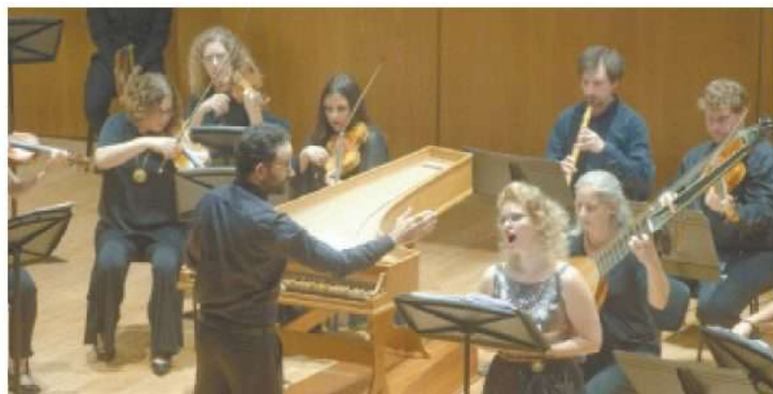
"אסיס, גלתיאה ופוליפמוס". החיבור בין סיפור ומוזיקה מתגשם בעוצמה