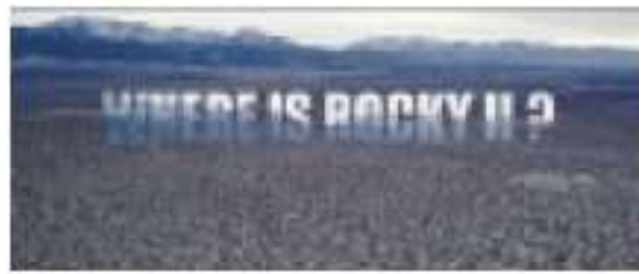
פייר ביסמוט, "איפה רוקי 2?", 2016

הקרנת הסרט "איפה רוקי 2?" מוזיאון תל אביב. 29.6