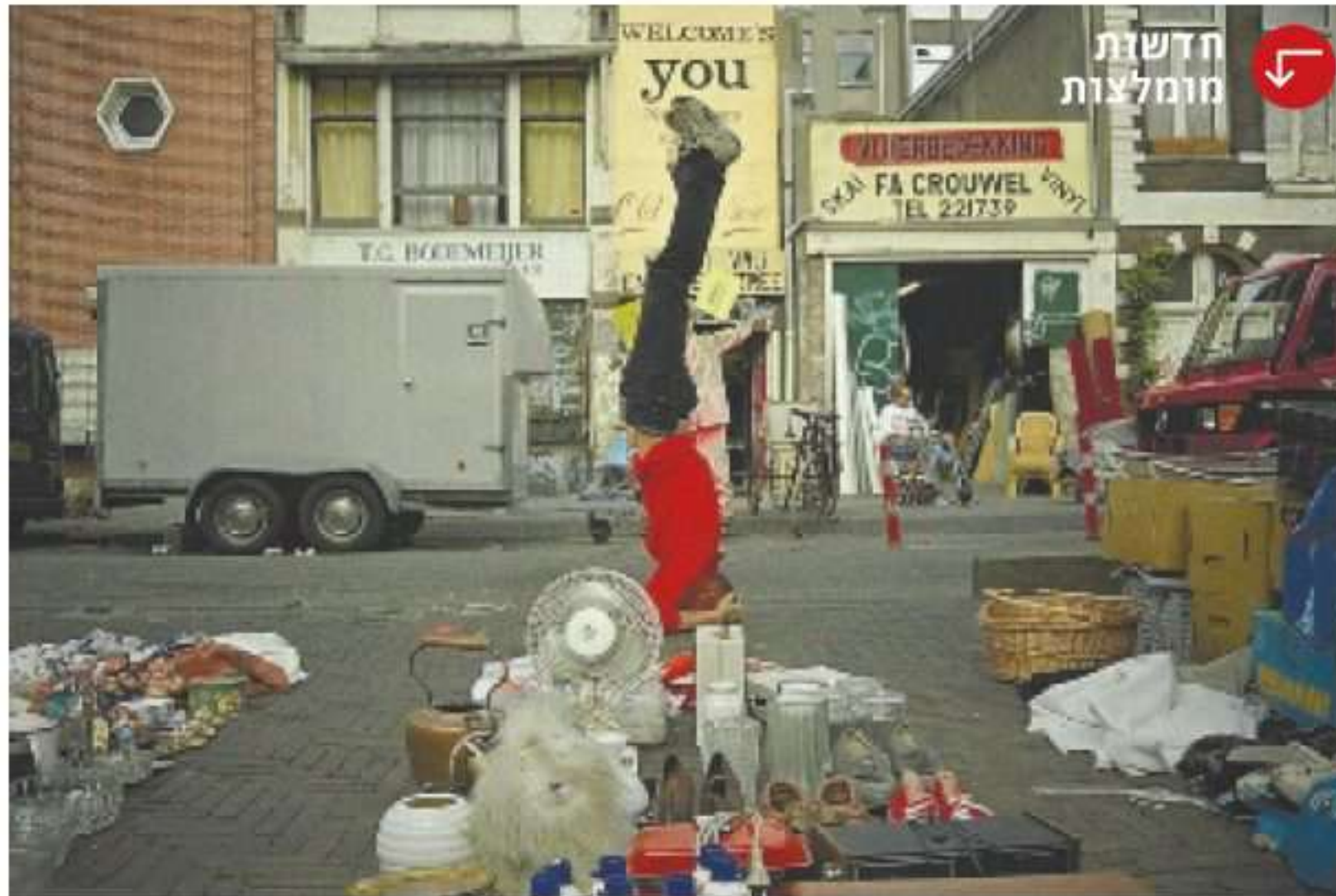
דאיניאוס ליסקוויצ'יוס, "The Centers of the World Enjoy Yourself", 1999. צילום: Dainius Liskevicius

כמוזיאון תל אביב יוקרן ביום שישי בצהריים הסרט "איפה רוקי 2?" של פייר ביסמוט. ההקרנה תהיה כחלק מהתערוכה "הוליווד ומיתוסים אחרים" שבה מציג ביסמוט את הגרסה המוויאלית של הסרט, מיצב וידיאו. הסרט מתמקד בניסיון לאתר פסל אבוד שהציב האמן האמריקאי אד רושה במדבר מוהאבי בקליפורניה בשנות ה-70 ומאז נעלמו עקבותיו. כחלק מחיפושיו אחר הפסל נוסע ביסמוט ללוס אנג'לס ושוכר את עזרתם של חוקר פרטי ושל תסריטאים. בעזרתו של החוקר הוא מנסה לאתר את הפסל במדבר בעזרת התסריטאים הוא טווה את העלילה של הסרט בהתהוות, שנע בין התייעודי לבדיוני. רותי דירקטור, אוצרת התערוכה, כותבת שכדרכם של סרטים שבבסיסם חיפוש, המסע הקולנועי בעקבות הפסל נע בין מקומות (הפארק הלאומי ג'ושוע טרי בקליפורניה, לוס אנג'לס, לונדון) ובין אנשים (מנהלי מוזיאונים, אספנים, אוצרים ועוד). ביסמוט "מתנהל בערמומיות בין עולמות האמנות והקולנוע, ותחת כותרת של שובר קופות הוליוודי יוצר סרט מבריק ומצחיק המזכיר מבחינת פיתולי ההתרחשות שלו את 'שמש נצחית' כראש צלול, הסרט שעל התסריט שלו זכה ביסמוט באוסקר ב-2005, יחד עם צ'רלי קאופמן".