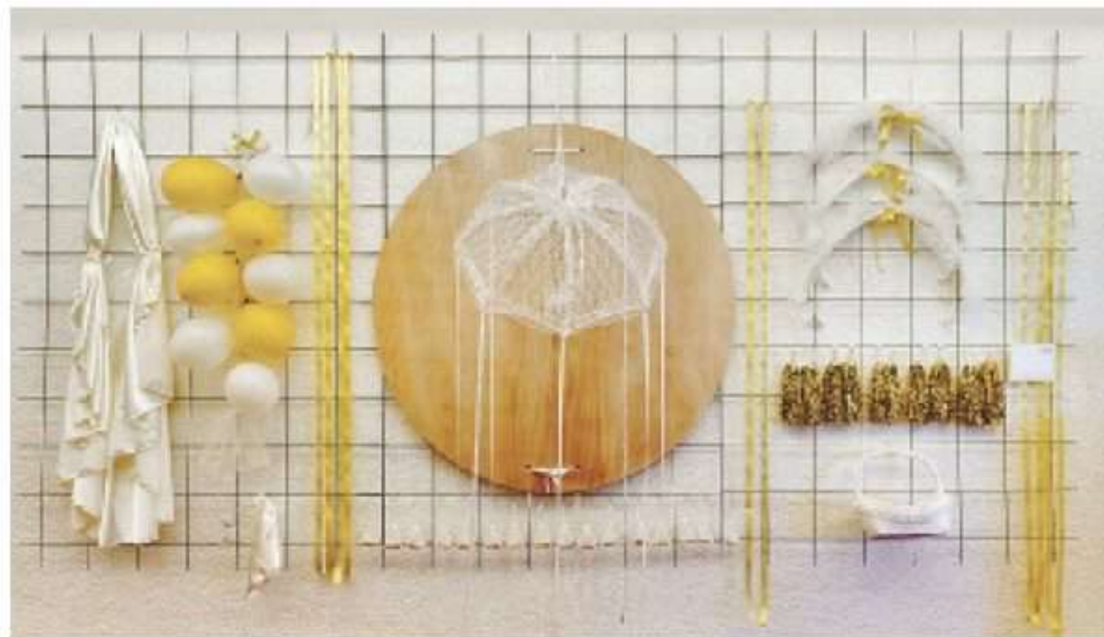
כלה של מרסל תהילה ביטון. התמודדות עם רווקות מאוחרת