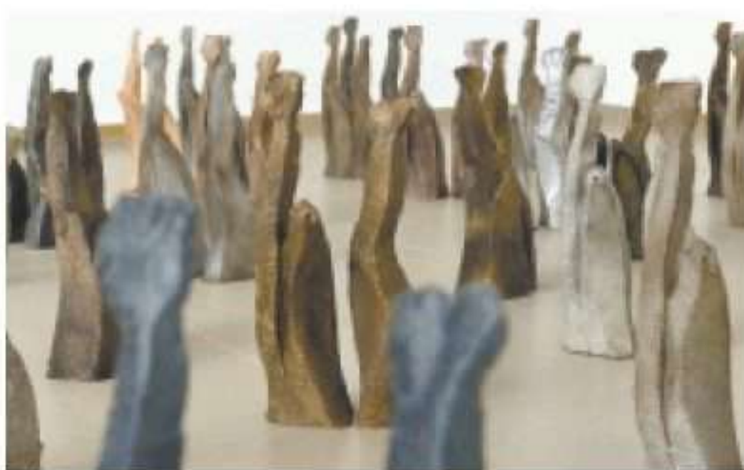
סנא פרח-בשורה, "48", 2018. בגלריה לאמנות באום אליפחם

חנה דוכן, רות טל ומרגריטה נאות מציירות את הקיץ דרך מראות חוף הים בתערוכה "הנה בא הקיץ..." אוצר: אבנר בר חמא.