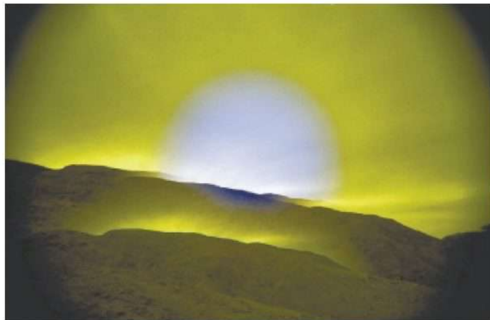
חנה סהר, מתוך הסדרה "שמשות ולילות", 2015