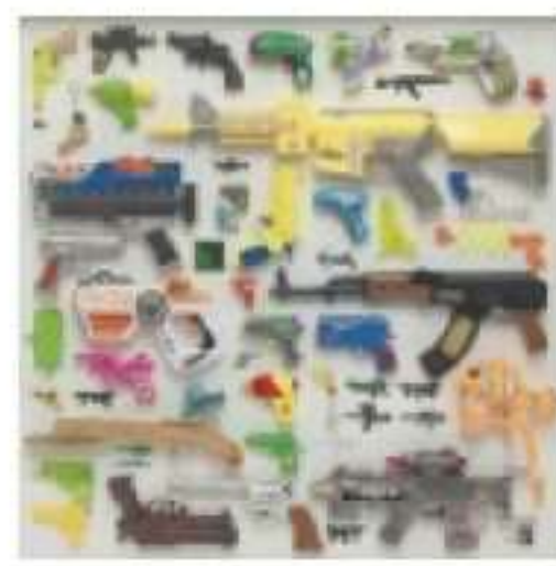
טל סנאי-צ'צקס, "ג'ירפה", 2018. בגלריה מאירוב בחולון

מוזיאון בית שטורמן. עין חרוד. גלי אגסי, טלי אמיתי-טביב, צדוק בן דוד, ציבי גבע ואמנים נוספים מציגים בתערוכת מחווה לאדם ברוך "אני אדם-מיטה" שתיפתח בצהריים. התערוכה מתכתבת עם 19 רשימות קצרות שברוך כתב על עצמו בבית החולים, במשך