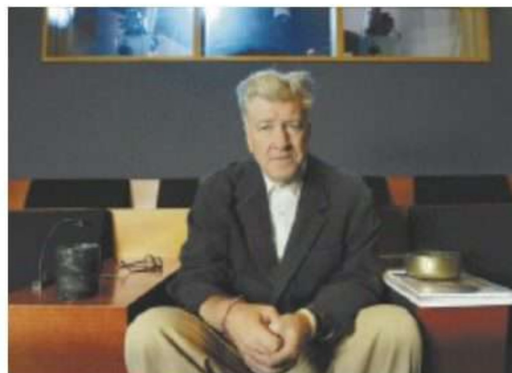
לינץ'. כוון את הספינה אל עתיד טוב יותר"

גם מנחי הלייט-נייט קולבר, פאלון ואוברין התאחדו כדי להגיב בהומור לנשיא